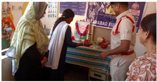
నిజామాబాద్ పోలీస్ కమిషనరేట్ లో..