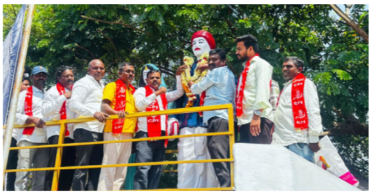
నగరంలో సీపీఐ ఆధ్వర్యంలో..