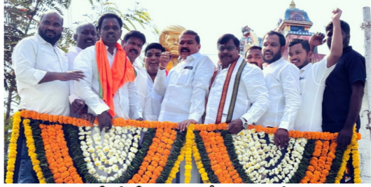
జీసీ జేపీసీ జిల్లా కమిటీ ఆధ్వర్యంలో..