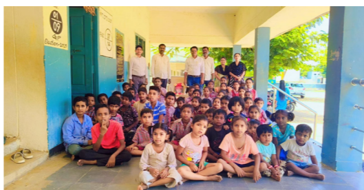
కొత్తపల్లి ఎస్పీ కాలనీలో..