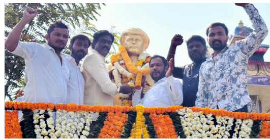
జాతీయ జీసీ సంక్షేమ సంఘం ఆధ్వర్యంలో..