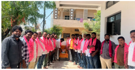
ఆర్కూర్ పట్టణంలో జిఆర్ ఎస్ ఆధ్వర్యంలో..