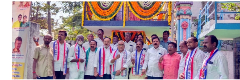
జీసీ సంక్షేమ సంఘం ఆధ్వర్యంలో..