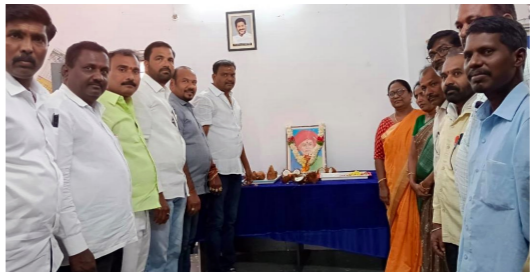
ఎల్లారెడ్డి మున్సిపల్ కార్యాలయంలో..