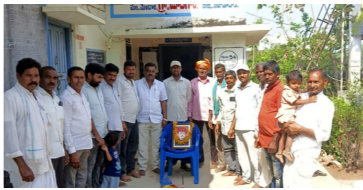
మెండోరా పోచంపాడ గ్రామపంచాయతీలో..