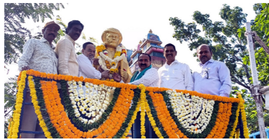
నిజామాబాద్ జిల్లా జీసీ ఉద్యోగుల సంఘం ఆధ్వర్యంలో..