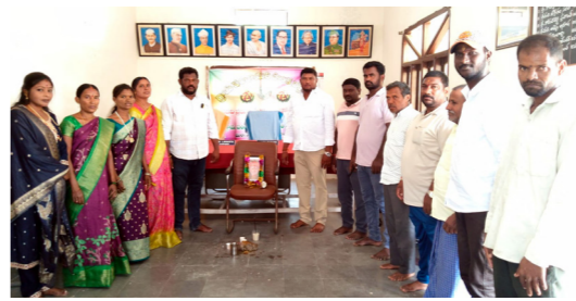
రెంజిల్లో సర్కంట్ లాభాణ్య భూమి వద్ద ఆధ్వర్యంలో..