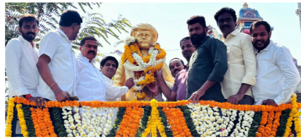
జాతీయ జీసీ ఉద్యోగుల సంఘం ఆధ్వర్యంలో..