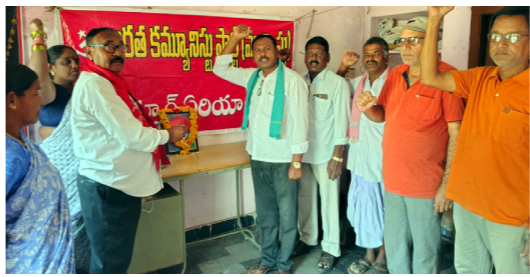
ఆర్కూర్ లోని సీపీఐ కార్యాలయంలో..