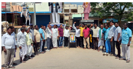
ముప్పాల్ మండల కేంద్రంలో..