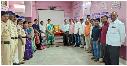
నిజామాబాద్ ఆర్టీసీ కార్యాలయంలో..