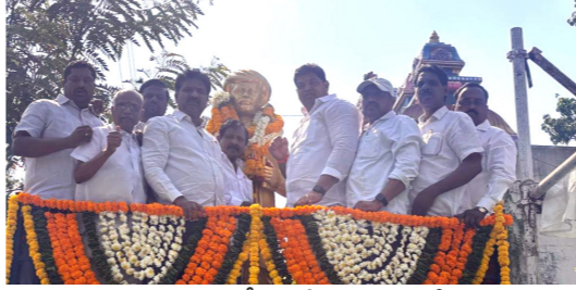
నిజామాబాద్ టీఎన్టీవోస్ ఆధ్వర్యంలో..