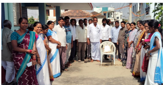
అలూరు మండలం మచ్చర్ల లో..