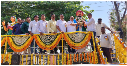
కామారెడ్డి టీఎన్టీవోస్ ఆధ్వర్యంలో..