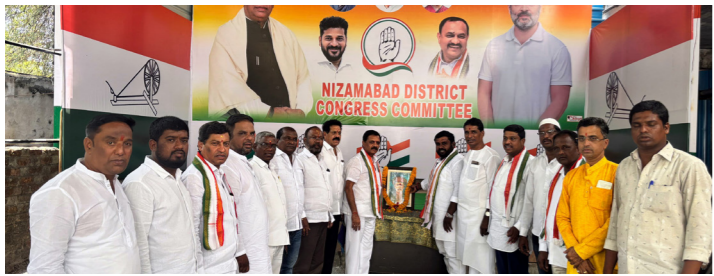
నగరంలోని కాంగ్రెస్ భవన్ లో..