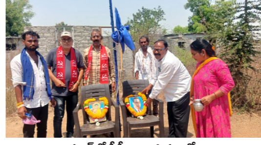
ఆర్కూర్ లో సీపీఎం ఆధ్వర్యంలో..