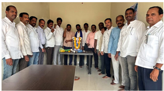
ఆర్కూర్ పీఆర్టీయూ ఆఫీస్ లో..