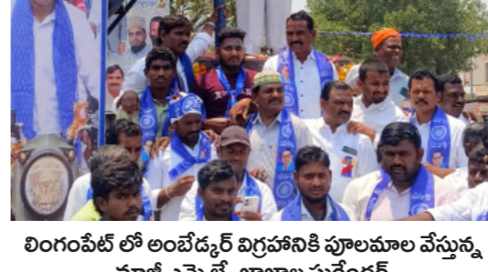
మాజీ మేయర్ సంజయ్ ఆధ్వర్యంలో..