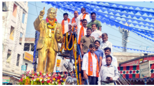
బాన్సువాడలో తపస్ జిల్లా శాఖ ఆధ్వర్యంలో..