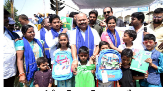
మాజీ మేయర్ సంజయ్ ఆధ్వర్యంలో..