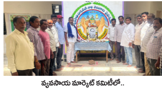
వ్యవసాయ మార్కెట్ కమిటీలో..