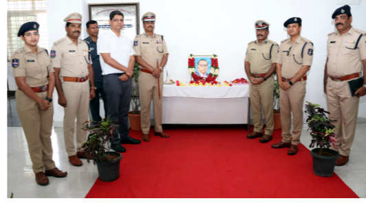
కామారెడ్డి ఎస్సీ కార్యాలయంలో..