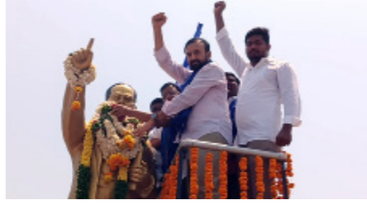
ఎల్లారెడ్డిలో ఎమ్మెల్యే ఆధ్వర్యంలో..