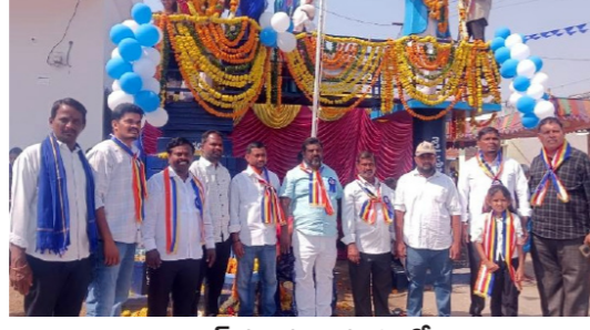
ఆర్కూర్ మండలం మచ్చర్లో..