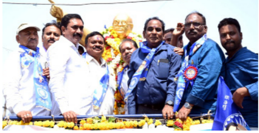
ఉద్యోగ సంఘాల ఆధ్వర్యంలో..

ఉమ్మడి జిల్లాలో అంబేద్కర్ జయంతిని ఘనంగా నిర్వహించారు. ఈ సందర్భంగా ఆయన చిత్రపటాలు, విగ్రహాలకు పూలమాలలు వేసి ఘనంగా నివాళులర్పించారు. ఆయన రూపొందించిన భారత రాజ్యాంగం స్ఫూర్తితోనే దేశంలో అన్ని వర్గాల వారికి అభివృద్ధి, సంక్షేమ ఫలాలు అందుతున్నాయని వక్రలు పేర్కొన్నారు. - అక్షరటుడే, నెలవర్క