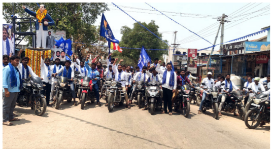
లింగంపేట బైక్ ర్యాలీ