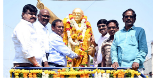
జీజీహెచ్ ఉద్యోగుల ఆధ్వర్యంలో..