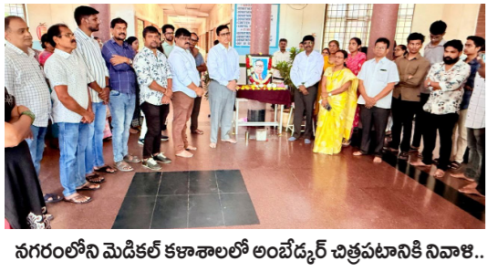
నగరంలోని మెడికల్ కళాశాలలో అంబేద్కర్ చిత్రపటానికి నివాళులు..