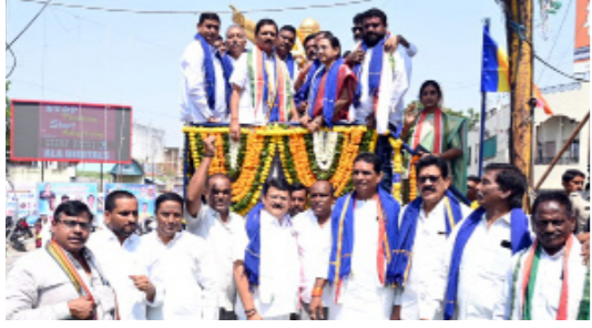
నిజామాబాద్ నగరంలో కాంగ్రెస్ ఆధ్వర్యంలో..