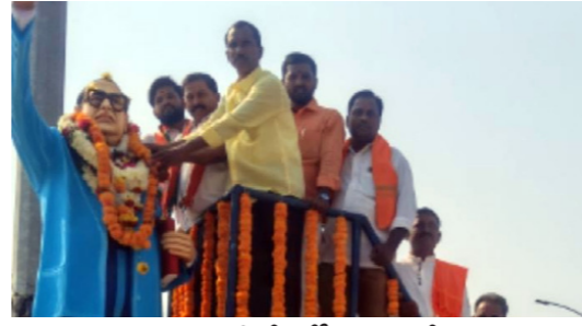
ఎల్లారెడ్డి లో జీజీపీ ఆధ్వర్యంలో..