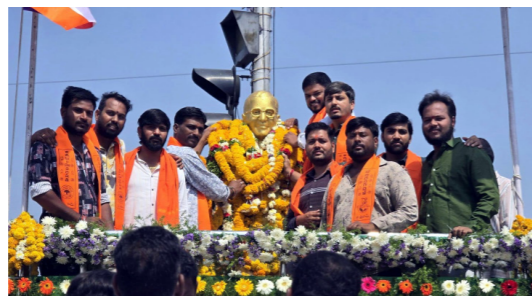
ఆర్కూర్ విశ్వ హిందూ పరిషత్ ఆధ్వర్యంలో..