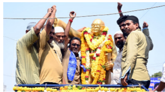
అటో యూనియన్ ఆధ్వర్యంలో..