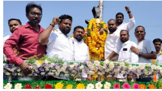
ఆర్కూర్ లో ఎమ్మార్పీఎస్ ఆధ్వర్యంలో..