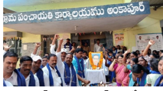
ఆర్కూర్ మండలం అంకాపూర్ గ్రామంలో..