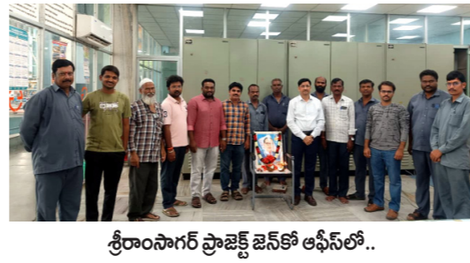
శ్రీరాంనగర్ ప్రాజెక్ట్ జెన్ టో ఆఫీస్ లో..