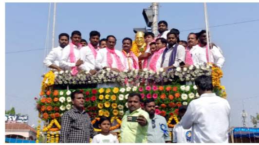
ఆర్కూర్ పట్టణ టీఆర్ఎస్ ఆధ్వర్యంలో..