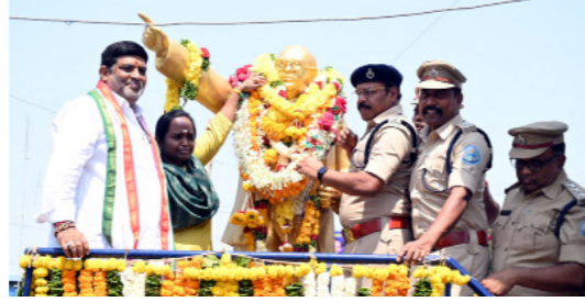
డీటీసీ, డిసీ ఆధ్వర్యంలో..