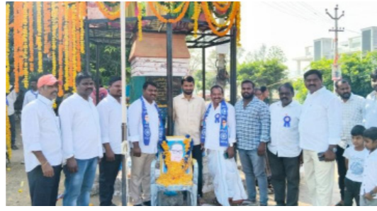
ఆర్కూర్ మండలం గోవింద్ పేట్ లో..