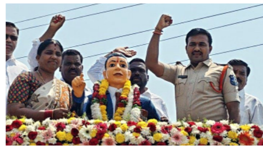
భక్తసూరలో ఎస్సెంబ్లీ అవరణ యులు ఆధ్వర్యంలో..