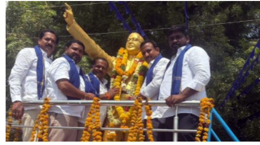
ఆర్కూర్ మండలం పిల్లి గ్రామంలో..