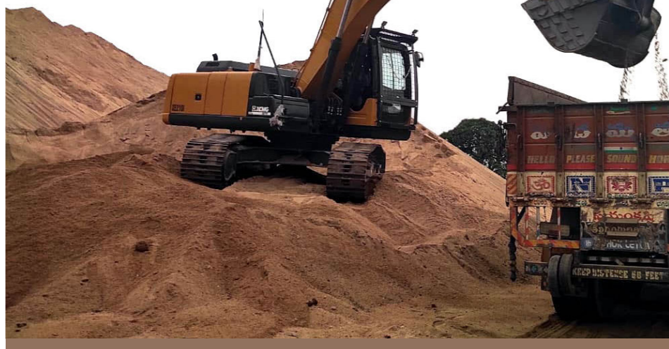
కోటిగిరి మండలంలో దర్జాగా తవ్వకాలు.. పోతంగల్, హంగర్ల, కారేగాం క్వారీల్లో దోపిడీ రైతులు, సామాన్యులకు ఇబ్బందులు

కోటిగిరి మండలంలో ఇసుక క్వారీల్లో ఇష్టారాజ్యంగా తవ్వకాలు జరుగుతున్నాయని ఆరోపణలు వెల్లువెత్తుతున్నాయి. ఆన్లైన్ యాప్లో ఇసుక కోసం నమోదు చేసుకున్న తర్వాత లోడింగ్ కోసం క్వారీకి వెళ్లే ఇష్టారాజ్యంగా వసూలు చేస్తున్నారని బాధితులు ఆరోపిస్తున్నారు. దీనిపై అధికారులు స్పందించాలి ఉన్న నిర్లక్ష్యం వహిస్తున్నారని ప్రజలు పేర్కొంటున్నారు. - అక్షరటూడే, కోటిగిరి