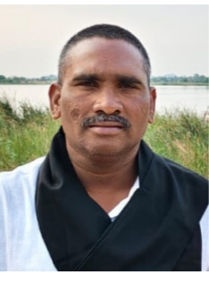
- సోంపూర్ పోలీస్, ఎమ్మర్లెస్ ఎన్ జిల్లా సహాయక కార్యదర్శి

కారేగాం లిఫ్ట్ ఇరిగేషన్ ద్వారా ప్రజలకు నీరు సరఫరా అవుతుంది. ఇసుకను తోడియడం ద్వారా మోటార్ల ద్వారా నీరు ఎలా వస్తుంది. ఇందిరమ్మ ఇళ్లకు ఇసుక కావాలంటే ఇసుక దొరకడం లేదు. ఆన్లైన్ టెండర్ల కావడం లేదని ప్రజలు అగ్రహం వ్యక్తం చేస్తున్నారు. ఉమ్మడి మండలాల్లో ఇసుక లేక ఇందిరమ్మ ఇళ్లకు అనుమతి ఇవ్వాలి. ట్రాక్టర్ల ద్వారా ఇసుక తరలింపునకు అనుమతి ఇవ్వాలి.